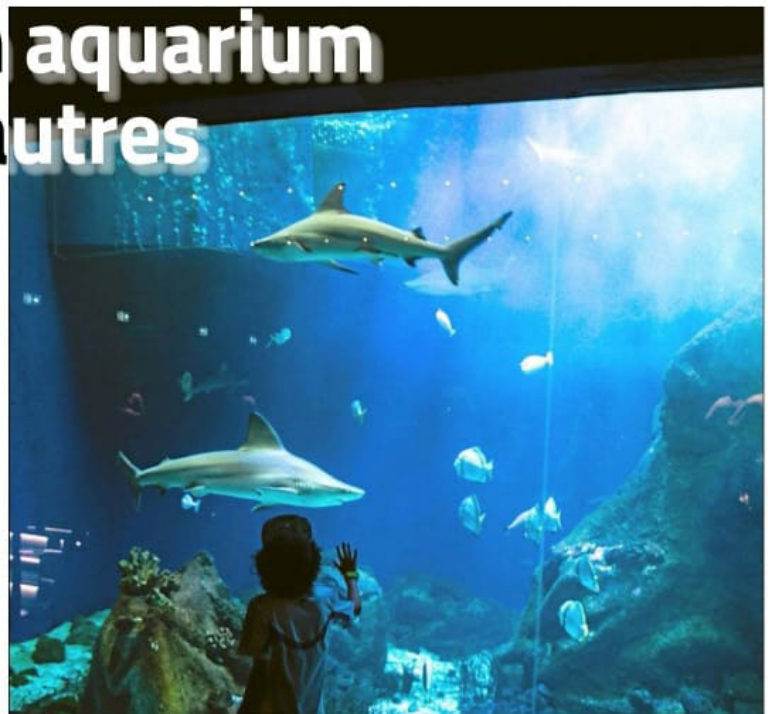
Requins taureaux et requins gris sont le clou de l'immersion à Oniria.