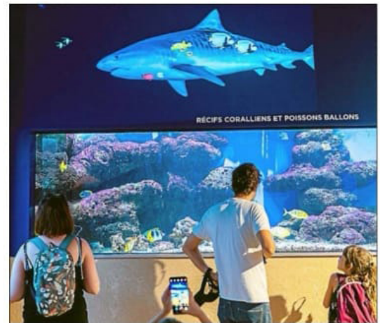
RÉCIFS CORALLIENS ET POISSONS BALLONS

S'ensuivent la salle des temps préhistoriques, puis celle des brumes marines où l'on revient à l'état premier de l'eau. L'avant-dernier espace est celui de «l'eau et les hommes», où sont exposées des maquettes de plusieurs bateaux.